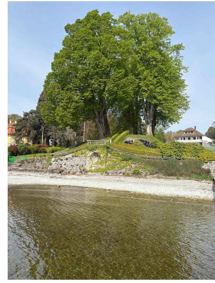
Grève + enrochement + portails