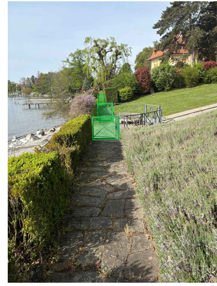
Portails + servitude passage