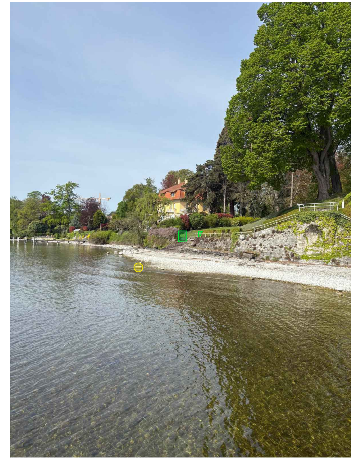
Grève + enrochement + portail + corps mort