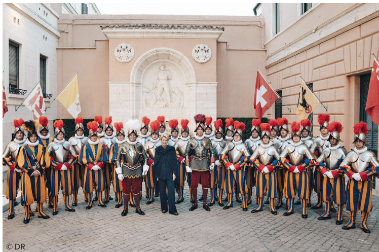
Visite de la Présidente de la Confédération, Karine Keller-Sutter au mois d'octobre dernier.

émotions. Mon premier Noël à Rome reste gravé dans mon esprit. La fête que j'ai toujours fêtée en famille jusque-là, je l'ai passée cette fois-ci avec ma nouvelle famille qui est la Garde. J'ai ensuite eu le privilège de servir deux papes et ainsi de vivre au sein du Vatican lors d'un siège vacant.