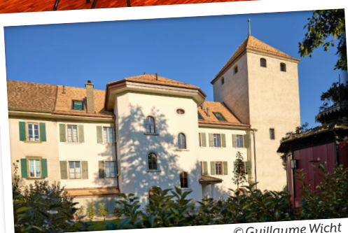
La Tour du Château