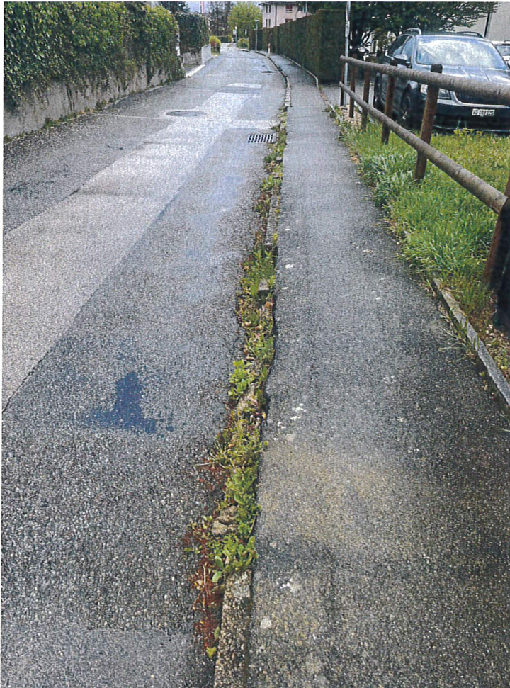
Fig. 7, Bordure du trottoir manquante et végétation envahissante