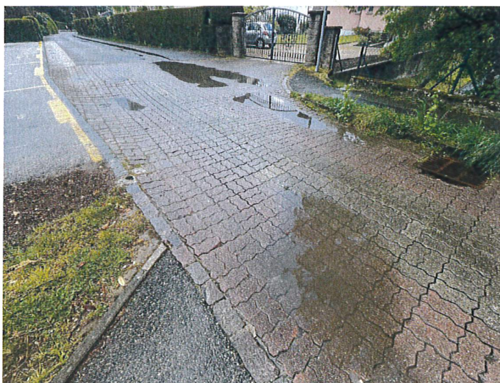
Fig. 8, Irrégularité et trous de la surface perméable de revêtement du milieu du chemin