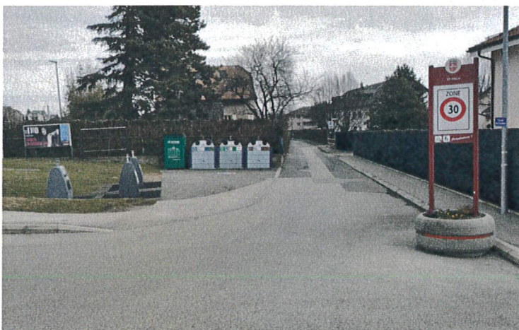
Fig. 1, Entrée de la rue depuis la route cantonale RC1

Les interventions projetées sur «Le Cheminet» font partie d'un aménagement global visant à réviser les infrastructures routières à l'échelle de la Commune.