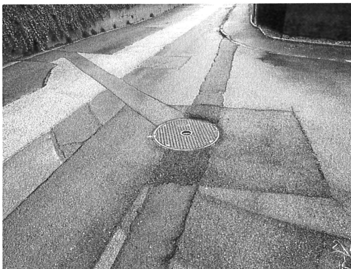
Fig. 6, Taconnages multiples et irrégularité de la chaussée

Cette demande de crédit d'étude a comme objectif de financer la réalisation des phases SIA 32 à 41, en couvrant ainsi les honoraires prévus pour ces phases. En revanche, les prestations d'ingénieur civil pour les phases travaux SIA 51 à 53 (51 projet d'exécution, 52 exécution de l'ouvrage, 53 mise en service, achèvement) feront l'objet d'une autre demande de crédit pour les travaux qui sera soumise au Conseil communal suite à l'exécution des phases SIA 32 à 41. Le montant pour ces prestations a été estimé à environ Fr 76'000.00 dans le cadre du premier appel d'offres.