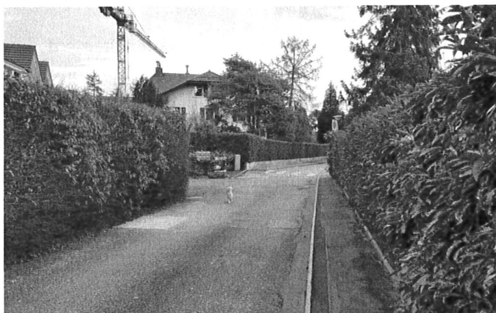
Fig. 3, Effet couloir créé par des haies de part et d'autre