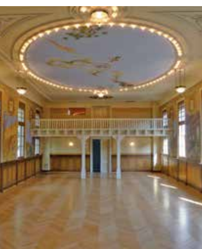
La Salle de la Paix

La Salle de la Paix. L'arrivée en terre protestante de cette importante population à obédience catholique ne va pas se faire sans mal. En 1918, la création de la Salle de la Paix, encore visible aujourd'hui entre la verrerie et l'église catholique, favorise une entente réciproque entre ces deux types de population. Car dès les débuts, cet édifice, destiné en premier lieu aux employés de l'usine, était aussi ouvert aux sociétés locales. Dans l'esprit paternaliste de l'époque, les activités proposées dans cette salle permettaient de tisser des liens entre les employés, mais aussi d'éviter que les ouvriers ne passent trop de temps à s'égarer, par exemple dans les bistros des alentours. Dans la même optique, les fresques ornant les