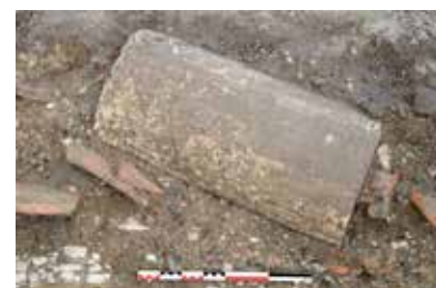
Fût de colonne