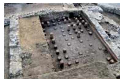
Pièce à abside