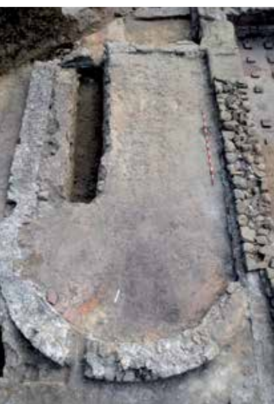
Pièce à hypocauste

Les éléments architectoniques ou décoratifs rencontrés (colonnes en pierre, placages de marbre, peintures murales, etc.) reflètent un cadre de vie luxueux, dont on pourra saisir le fonctionnement quotidien par l'étude du mobilier récolté (vaisselle en céramique et en verre, monnaies, ossements animaux, etc.). À l'échelle régionale, cette découverte s'ajoute à la liste restreinte des villas antiques explorées sur l'arc lémanique (Pully, Commugny) et constitue un précieux témoignage des processus de romanisation du territoire helvète au tournant de notre ère. Au niveau local, l'identification de cet établissement, encore en fonction durant l'Antiquité tardive (3 e -4 e s.), permettra certainement de poser un regard nouveau sur la genèse du bourg médiéval de Saint-Prex.